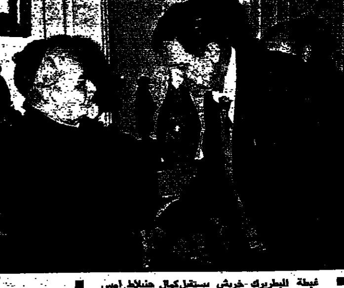
غبطة البطريرك خريش يستقبل كمال جنبلاط امس

القاهرة - من عزت صافي : أكد وزير الخارجية المصرية ان مؤتمر جنيف لا يمكن ان ينفذ دون ائتماعه الجديدة في العلاقات المصرية - السوفياتية خلال زيارة السيد فرديكو فروبيكو ، الى بيروت في وقت اخر حول العلاقات المصرية - السوفياتية . وقد استقبلني السيد اسماعيل فهمي في مكتبه بوزارة الخارجية امس في القاهرة ظهر امس ، ولم ان يوم الجمعة عطلة رسمية . وخلال ساعتين تحدثت في كل المواضيع والقضايا العربية الدولية الخارجه ، وكان امها صفحة العلاقات الجديدة بين مصر والاتحاد السوفياتي . وكان السؤال الاول حول هذا الموضوع : ما هي الموانع الجدية التي طرأت على العلاقات المصرية - السوفياتية خلال زيارة السيد فرديكو فروبيكو ، الى بيروت في وقت اخر حول العلاقات المصرية - السوفياتية . وقد استقبلني السيد اسماعيل فهمي في مكتبه بوزارة الخارجية امس في القاهرة ظهر امس ، ولم ان يوم الجمعة عطلة رسمية . وخلال ساعتين تحدثت في كل المواضيع والقضايا العربية الدولية الخارجه ، وكان امها صفحة العلاقات الجديدة بين مصر والاتحاد السوفياتي .